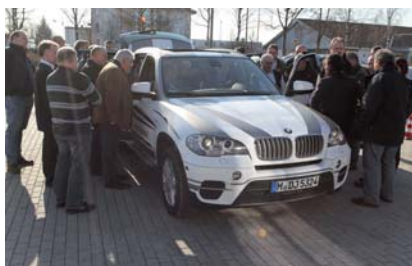
Testfahrzeug der BMW-Unfallforschung

übermittelt, wird in den nächsten Jahren Einzug in Neufahrzeuge halten. Bei BMW gibt es die Funktion des automatischen Notrufes bereits und nach auslösen des Airbags oder der Crash-Sensoren wird automatisch ein Notruf über eine unfallsichere, im Fahrzeug fest verbaute Telefonieinheit an das BMW Assist Callcenter abgesetzt. Der Mitarbeiter im Callcenter nimmt Kontakt mit dem Fahrzeugführer auf und erkundigt sich nach dem Befinden der Insassen. Über die gleiche Verbindung werden ebenfalls die metergenaue Fahrzeugposition und weitere für die Rettung relevante Daten wie zum Beispiel Verletzungsrisiko, Sitzbelegung sowie das Modell des Fahrzeugs übermittelt. An einem Testfahrzeug konnten sich die Tagungsteilnehmer bei einer Unfallsimulation vom System selbst überzeugen.