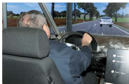
Fahrsicherheitstraining im Simulator

Die Fahrsicherheit mit Sonder- und Wegerechten soll verbessert werden. Hierzu will der Gemeindeunfallversicherungsverband (GUVV) über eine Kooperation mit dem LFV Bayern ab Sommer/Herbst 2011 Fahrsicherheits-trainings mit entsprechenden Schulungen für die Feuerwehren der Stadt- und Kreisfeuerwehverbände anbieten, um den Fahrern von Feuerwehrfahrzeugen ein besseres Fahrzeuggefühl zu vermitteln, damit sie im Ernstfall richtig reagieren.