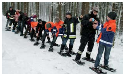
Kleine Spiele zwischendurch sollen Kommunikation und Zusammenarbeit verbessern.

Die Schatzsuche per Satellit war natürlich nicht der einzige Programmpunkt des Erlebniswochenendes: Mit ihren Nationalparkführern besuchten die Jugendlichen auch das Tiergehege im Nationalpark und