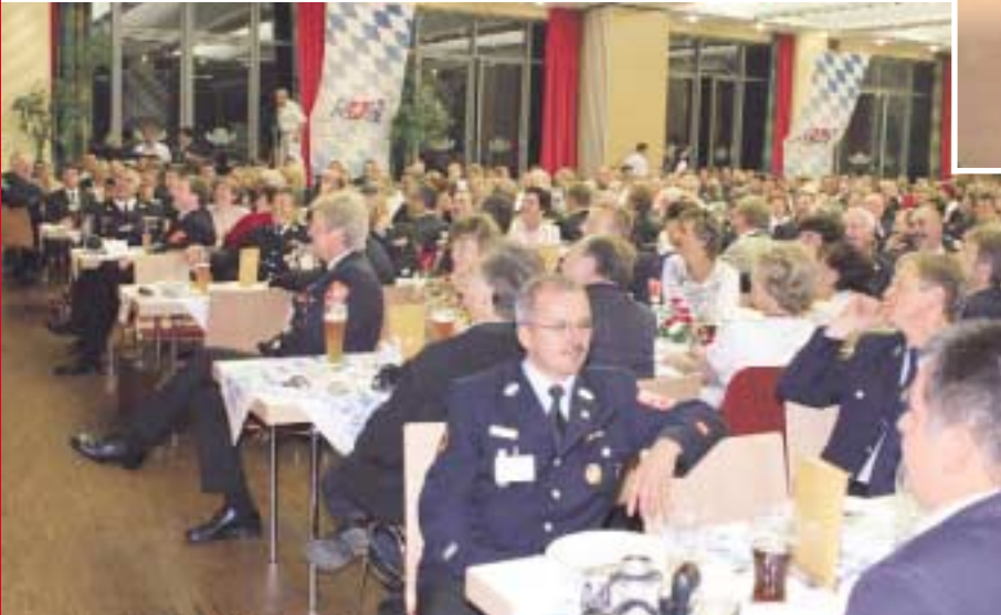
Entspannte Gesichter beim Bayernabend - einem Highlight der 11. Landesverbandsversammlung