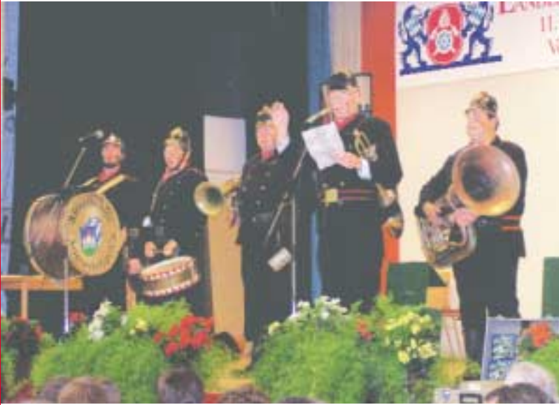
Die Altneihausser Feuerwehrcapell'n begeisterte mit ihrem Auftritt und nahm die bayerische Sparpolitik aufs Korn.