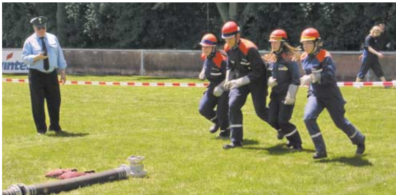
Getreu dem Feuerwehraktionsmotto – wir machen uns fit für morgen – Feuerwehrjugend bei der Ausbildung

In diesem Zusammenhang danke ich allen unseren Arbeitgebern, die uns den ehrenamtlichen Feuerwehrdienst noch ermöglichen. Ich appelliere gleichzeitig an die Arbeitgeber, auch künftig uns für Ausbildung und Einsätze ohne jegliche Nachteile freizustellen.