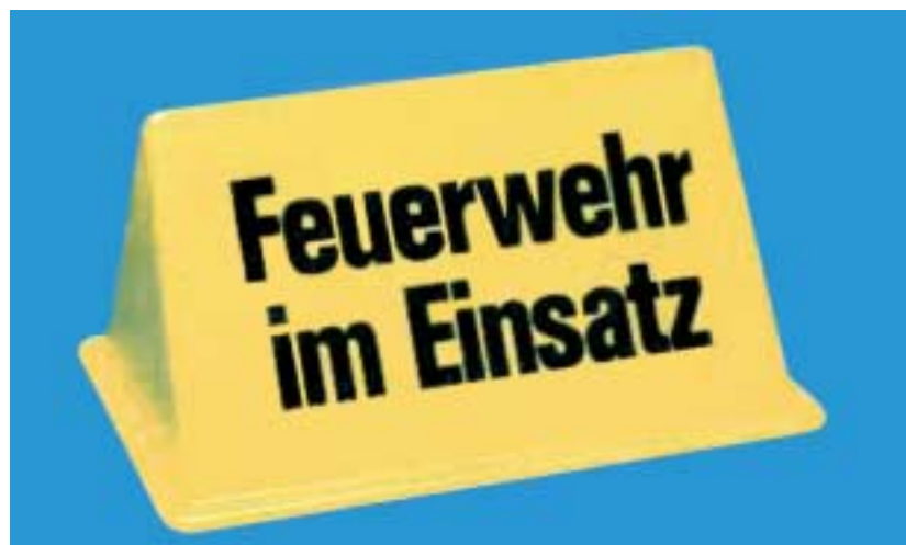
Hier nochmals der Hinweis, dass der Handel beleuchtete Dachaufsetzer vertreibt, diese aber nicht zugelassen sind.