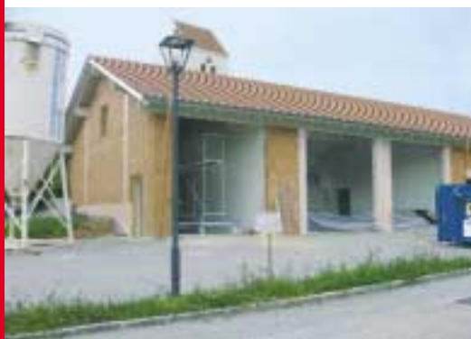
Feuerwehrgerätehaus Haunersdorf Lkr. Dingolfing

Es sollen in Zukunft aus Sicht des IM nur noch Neubauten und Erweiterungsbauten gefördert werden