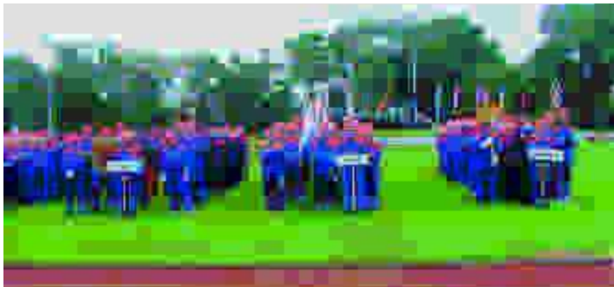
Nicht gerade vom Wetter begünstigt traten 29 bayerische und zwei Gästegruppen aus dem Ausland zum Landesentscheid im Bundeswettbewerb der Deutschen Jugendfeuerwehren an. Im Bild ein Auszug der Teilnehmer.

In der Nacht zum Samstag hob eine Sturmböe das Zelt einer Jugendfeuerwehr im Zeltlager ab und wehte es in eine angrenzende Pferdekoppel.