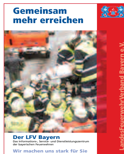
Der neu aufgelegte Imagefolder „Gemeinsam mehr erreichen“ stellt die Leistungen des LFV Bayern und die damit verbundenen Vorteile dar und kann somit effektiv zur Gewinnung neuer Mitgliedsfeuerwehren genutzt werden (siehe auch Bericht auf Seite 7)

Zusammen mit dieser Ausgabe von Florian kommen werden die Imagefolder an die Kreis- und Stadtbrandräte ausgeliefert (jeweils 2 Stück pro Feuerwehr).