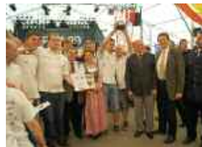
So sehen Sieger aus: zwei Gruppen der Feuerwehr Katschenreuth ( Lkr. KU ) belegten die Plätze eins und zwei, gefolgt von Wolfsloch ( Lkr. LIF ). Die Ehrengäste feierten mit.

Anlässlich der Delegiertenversammlung standen die wichtigsten Themen auf der Tagesordnung, die die Zukunft der ehrenamtlichen Hilfsorganisation in Bayern sichern sollen. Obgleich