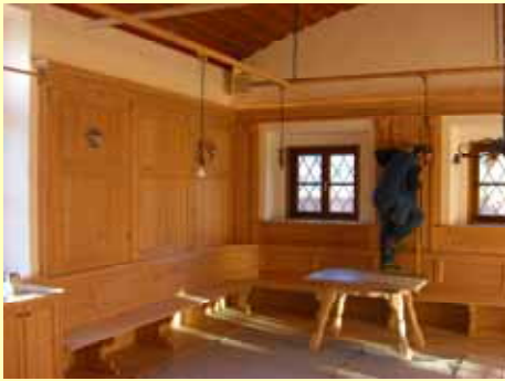
Das neue „Bierstüberl“ ist fast fertig