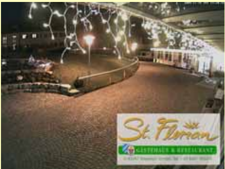
Ein erster Versuch