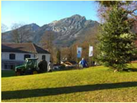
Der Christbaum steht schon ....