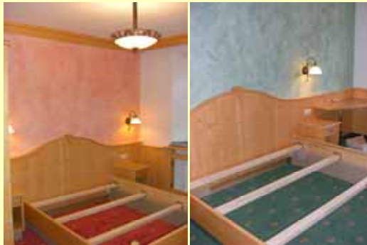
die neuen Zimmer im Haus Lattenberg sind fertig und müssen nur noch bestückt werden

Nächste Woche werden wir Ihnen auf diesem Wege die fertigen Räume, Zimmer und Dekorationen zeigen. Eines aber können wir jetzt schon sagen: „ es wird wirklich schön und wir werden eine wunderbare, vorweihnachtliche Stimmung haben“.