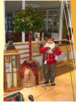
und auch der Nikolaus...