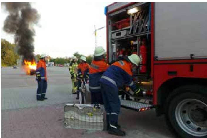
Die Jugendfeuerwehr Dingolfing einsatzbereit für den ersten Löscheinsatz.