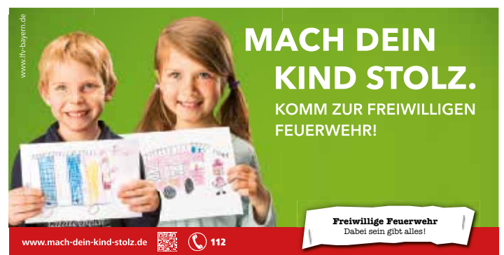
Kampagne 2014/15 „Mach Dein Kind stolz. Komm zur Freiwilligen Feuerwehr!“