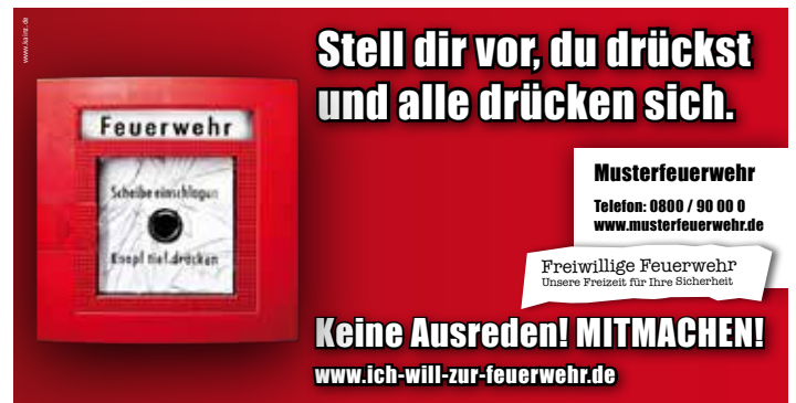
Kampagne 2011/12 „Stell dir vor, du drückst und alle drücken sich. Keine Ausreden! Mitmachen!“