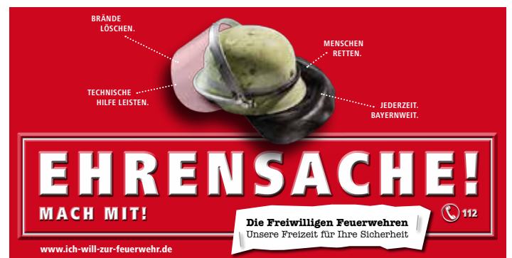
Kampagne 2013/14 „Ehrensache! Mach mit!“