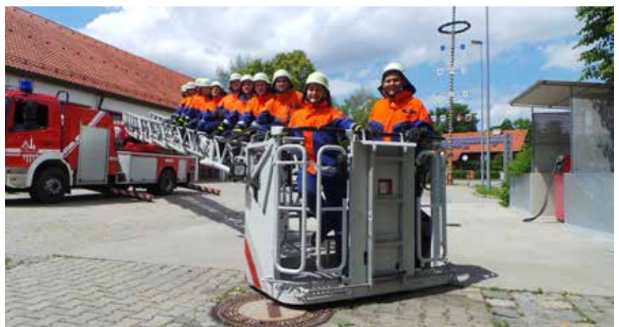
Hey, wir sind der Nachwuchs der Feuerwehr Dingolfing.