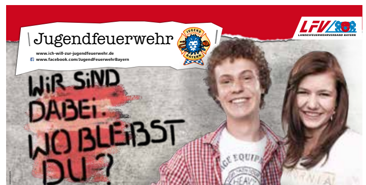
Kampagne 2012/13 „Wir sind dabei. Wo bleibst Du?“