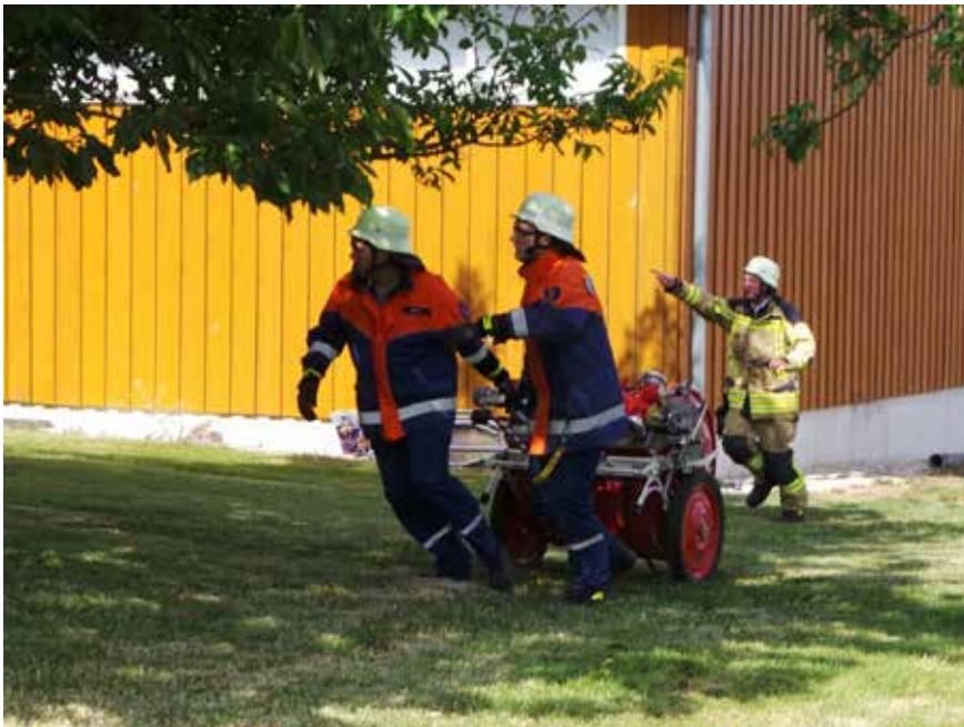
Der Bauernhof brennt: Voller Einsatz mit der Schlauchhaspel.

Weißer Rauch steht im Treppenhaus. Was wurde im Unterricht gelernt? 600 Brandtote gibt es jedes Jahr und die meisten davon sterben durch giftige Rauchgase. Die Feuerwehrmänner können und dürfen deshalb nur mit einem Atemschutz in das Gebäude. Dafür brauchen sie aber einen speziellen Lehrgang, den sie erst mit 18 Jahren absolvieren können. Bei der Jugendfeuerwehr tun es im Moment noch die selbst gebastelten Masken, die ein wenig erahnen lassen, was das für ein Gefühl ist mit Maske in einen verqualmten Raum zu gehen – und dieser Rauch war auch nicht giftig, sondern Disconobel.