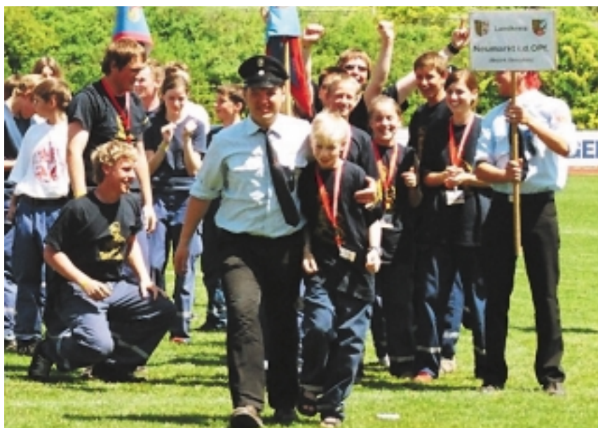
Die Siegergruppe aus Batzhausen, Landkreis Neumarkt i.d. Opf.

Während sich die Jugendfeuerwehren am Freitag Vormittag auf den Wettbewerb vorbereiteten und den Nachmittag zu ausführlichen Besichtigungen der Stadt Amberg und ihrer Umgebung nutzten, tagte der Landes-Jugendfeuerwehraus-