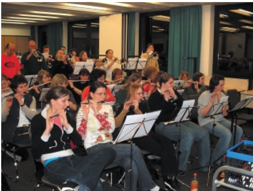
Das Flötenregister mit den neuen Konzertflöten (im Hintergrund) und vorne die B-Flöten