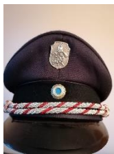
Müzenschnur weiß/rot für Vorsitzende

Die Vorsitzenden von Feuerwehrvereinen sind nunmehr neben der weiß/rot gewirkten Müzenschnur auch mit einem Funktionsabzeichen (zwei silberne Sterne mit rotem Rand) am linken Unterärmel über dem Dienstgradabzeichen erkenntlich. Die stellv. Vorsitzenden sind nun mit einem Funktionsabzeichen (ein silberner Stern mit rotem Rand) über dem Dienstgradabzeichen erkenntlich.